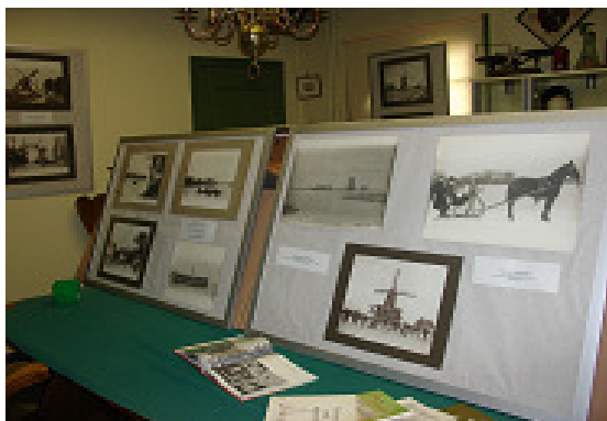
Foto van de tentoonstelling op monumentendag. Deze foto's van onder andere Jacob Starreveld en Jan Schermer worden vanaf eind november 2010 tentoongesteld in de hal van het gemeentehuis en zal te bezoeken zijn tot begin januari 2011 tijdens de openingsuren van het gemeentehuis.

Tijdens de Open Monumentendag afgelopen 12 september konden de bezoekers diverse oude foto's bekijken die de vereniging uit haar eigen collectie tentoonstelde.