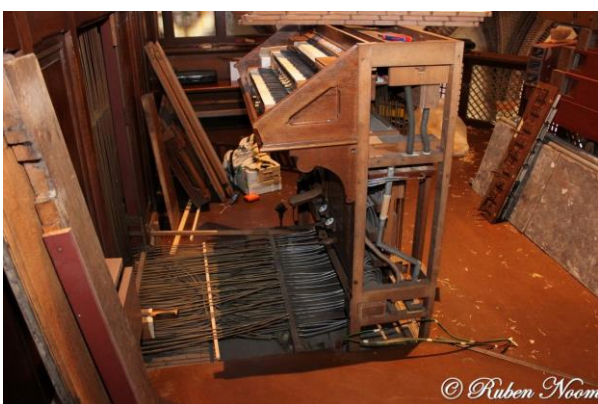
De orgelpijpen zijn verwijderd en de speeltafel wordt gedemonteerd.

De restauratie zal grotendeels worden uitgevoerd in het atelier te Hillegom. Om de te restaureren onderdelen van het orgel daar te krijgen is 16 februari j.l. een start gemaakt met een grootscheepse demontage van het orgel. Met name het verwijderen van de speeltafel was een grote klus. Hiervoor werd een speciale lift in de kerk geplaatst om de speeltafel, al het pijpwerk en de andere onderdelen van de koorzolder af te krijgen. Vervolgens werden de materialen verantwoord vervoerd naar Hillegom. Naar verwachting vindt de afronding plaats in september van dit jaar. Meer informatie over het Adema-orgel en foto's van de restauratie zijn te vinden op de website: www.ademaorgeluitgeest.nl