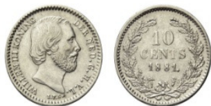
Recente vondst van Tom de Kleijn. Zilver muntstuk 10 cent koning Willem III (1881) vindplaats Uitgeestmeer.

Mocht u geïnteresseerd zijn en meer willen weten over deze prachtige hobby of een basiscursus willen volgen? Kom langs op onze verenigingsavond in het Regthuys iedere dinsdag van 19.30 -21.00 uur. Tom de Kleijn kan ook u het één en ander laten zien en er over vertellen.