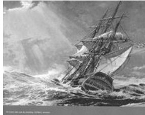
Het Engels fregat Lutine.