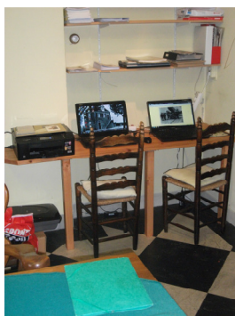
De nieuwe werkplek in het Regthuys.

Voor leden en bezoekers een grote vooruitgang.