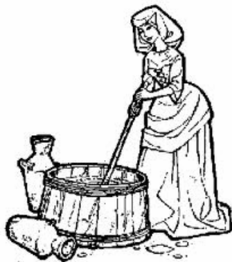
Afbeelding van een zoetelaarster; een ambulante brandewijn verkoopster